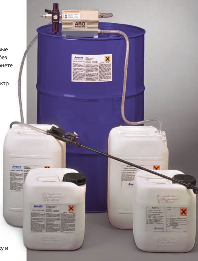
Avesta Classic Cleaner 401 – высокоэффективный очиститель нержавеющей стали.