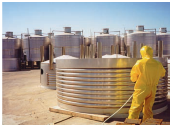
Чистка нержавеющей стальных винных танкеров.